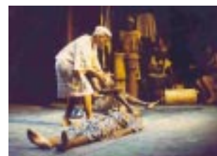
The Flame Players de Camerún

Exponer las personas jóvenes a una diversidad de culturas con colaboraciones de culturas que se cruzan