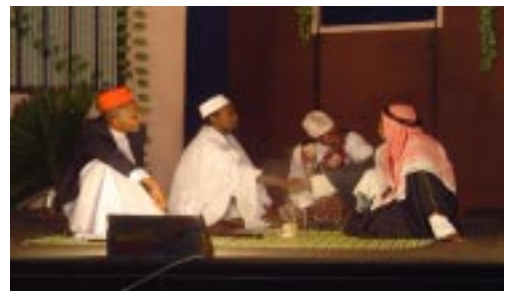
Eastern Africa Theatre Institute, EATI

Eastern Africa Theatre Institute , en colaboración con varios artistas suecos, grupos e instituciones, llevará a cabo su 3º EATI Regional Theatre Festival , del 22 al 27 de noviembre de 2004 , en Mombasa, Kenya para celebrar y mostrar la contribución del teatro al desarrollo social. El tema Concentrar los sueños de nuestra sociedad , celebra el rol del artista como un impulsador de las aspiraciones de la sociedad en su demanda por mejoras. El festival celebra el rol del teatro concentrándose en VIH y SIDA, resolución de conflictos, reducción/ erradicación de la pobreza, sexualidad y educación de niños. Mayores informaciones disponibles de Ghonche Materego : gmaterego@yahoo.com .