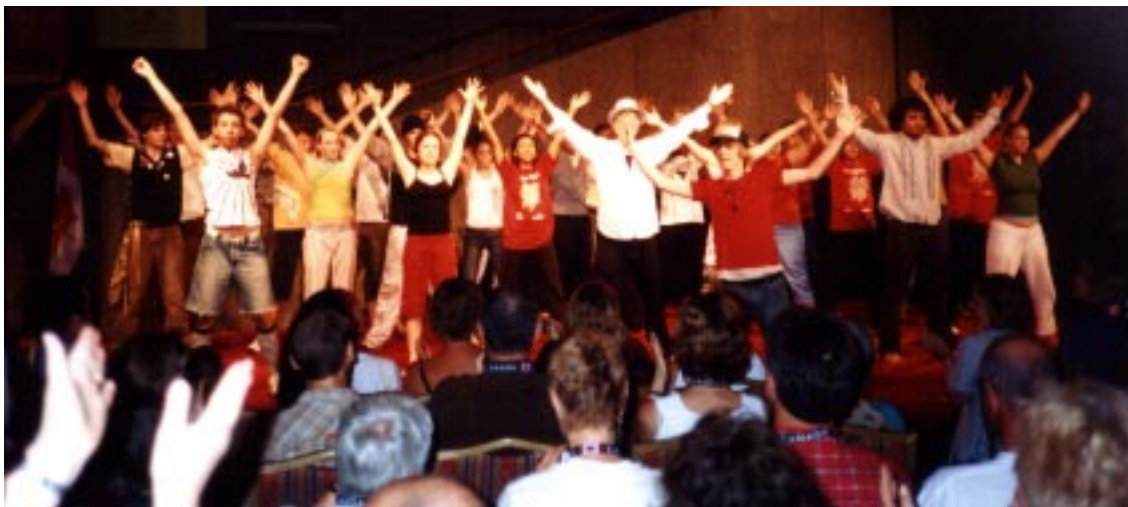
IDEA Joven cierra IDEA 2004 con una celebración de diversidad y de unidad multicultural

Celebrar IDEA y su trabajo en Asia, en Hong-Kong, cuando el teatro moderno ha sido introducido a China luego de 100 años, y los colonialistas británicos salido de Hong-Kong por una década para permitir un diálogo/multidiálogo de practicantes sobre de todo el mundo involucrados en teatro/drama y educación, para mostrar en forma paralela las actividades, los funcionamientos chinos y asiáticos etc. y asegurarse que la convergencia internacional de practicantes de todo el mundo sea un ímpetu significativo para el interés y el crecimiento de la educación de teatro/drama en Hong-Kong, continente China y Asia