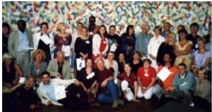
Retrato del grupo de los participantes de IDEA, de InSEA y de UNESCO en la Conferencia de Helsinki, 2003