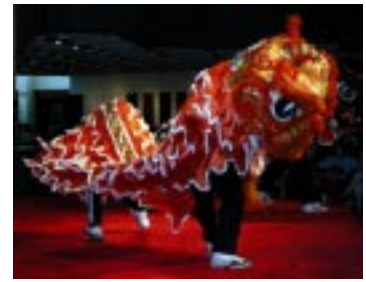
IDEA 2004

Soy miembro fundador de la Sociedad de los Pueblos Asiáticos del Festival del Teatro (APTFS) instalada en los años 90 para promover el teatro en Hong-Kong y para colaboraciones culturales de intercambio incluyendo los Festivales de los Pueblos Asiáticos del Teatro (APTFS) y El Viento Grande , El Tuyo lo más Obedientemente Posible etc, que viajó a través de ciudades asiáticas. He estado implicado en congresos de IDEA desde Brisbane, y actualmente soy un miembro del Comité Ejecutivo de TEFO (Hong-Kong Theatre/Drama y foro de la educación-miembro de IDEA en Hong Kong/China) y Co-Director del Congreso de IDEA 2007. He sido CEO de artes con la Asociación Lisiada Hong-Kong a partir de 1995 hasta 2004. Estaré involucrado en el trabajo del congreso de APTFS y de IDEA 2007 a tiempo completo en los tres próximos años. Soy practicante del teatro del oprimido , playback theatre , del desarrollo cultural de la comunidad.