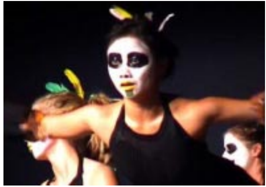
Los actores de Nueva Zelanda NZADIE, en escena, Les Polyscenes 2003 , Montpellier, Francia.

América Latina y Islas Caribeñas América del Norte Este y Sur de África Norte, Centro y Oeste de África Europa Occidental Europa Oriental Asia Central Suroriental de Asia Australia, Nueva Zelanda y Islas del Pacífico Medio-Este y Países Árabes Comunidad del teatro y personas que sepan pedagogía dramática Practicantes de Artes Aplicadas y Directores Artísticos