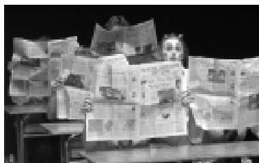
Artistas jóvenes de Niedersachsen en la escena en el BVDS 20avo Festival de Teatro Escolar en Stuttgart, Alemania, Setiembre del 2004.