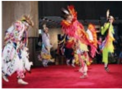
First Nation peoples tuvo un papel central en el Museu de la Civilización durante la noche cultural de IDEA 2004, Ottawa.

Como ahora nos proponemos a poner los proyectos de los miembros de IDEA en el centro, las definiciones de trabajo que han podido definir un proyecto de IDEA se incluyen abajo. Ésas deben ayudar a clarificar las expectativas del GTP.